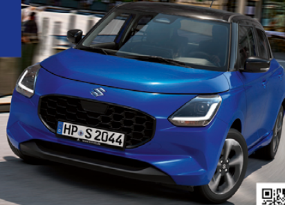
Abbildung zeigt aufpreispflichtige Sonderausstattung. Mehr Informationen zu Ausstattungslinie und Sonderausstattungen finden Sie hier: